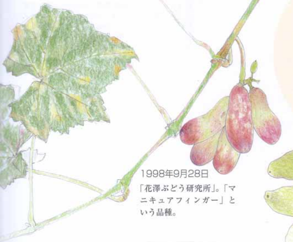
1998年9月28日 「花澤ぶどう研究所」。「マ ニキュアフィンガー」と いう品種。

雑誌を見て、 岡山市瀬戸町の 「花澤ぶどう研究所」を 訪ねました。 いろいろな 世界の珍しいブドウを 見せていただきました。 一粒一粒宝石のようで、 まるで宝石箱のようです。