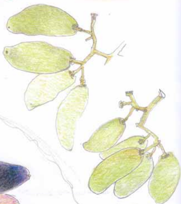
1998年9月28日 「レディーフィンガー」。

雑誌を見て、 岡山市瀬戸町の 「花澤ぶどう研究所」を 訪ねました。 いろいろな 世界の珍しいブドウを 見せていただきました。 一粒一粒宝石のようで、 まるで宝石箱のようです。