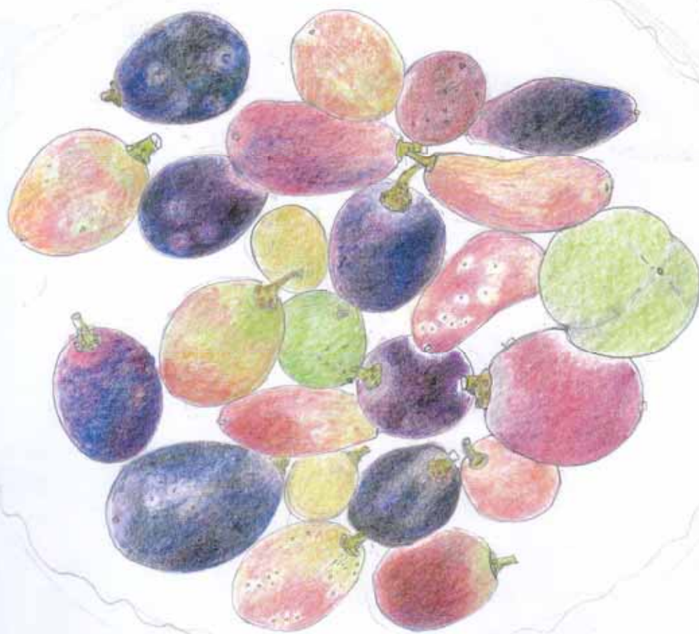
2000年9月30日 世界の珍しいブドウを、皿に 入れてスケッチ。一粒一粒が、 宝石のようで…。