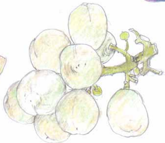
1998年9月22日 「瀬戸ジャイアンツ（商標名：桃太郎ブドウ）」。モモの実をイメージして、「花澤ぶどう研究所」で作られた品種です。